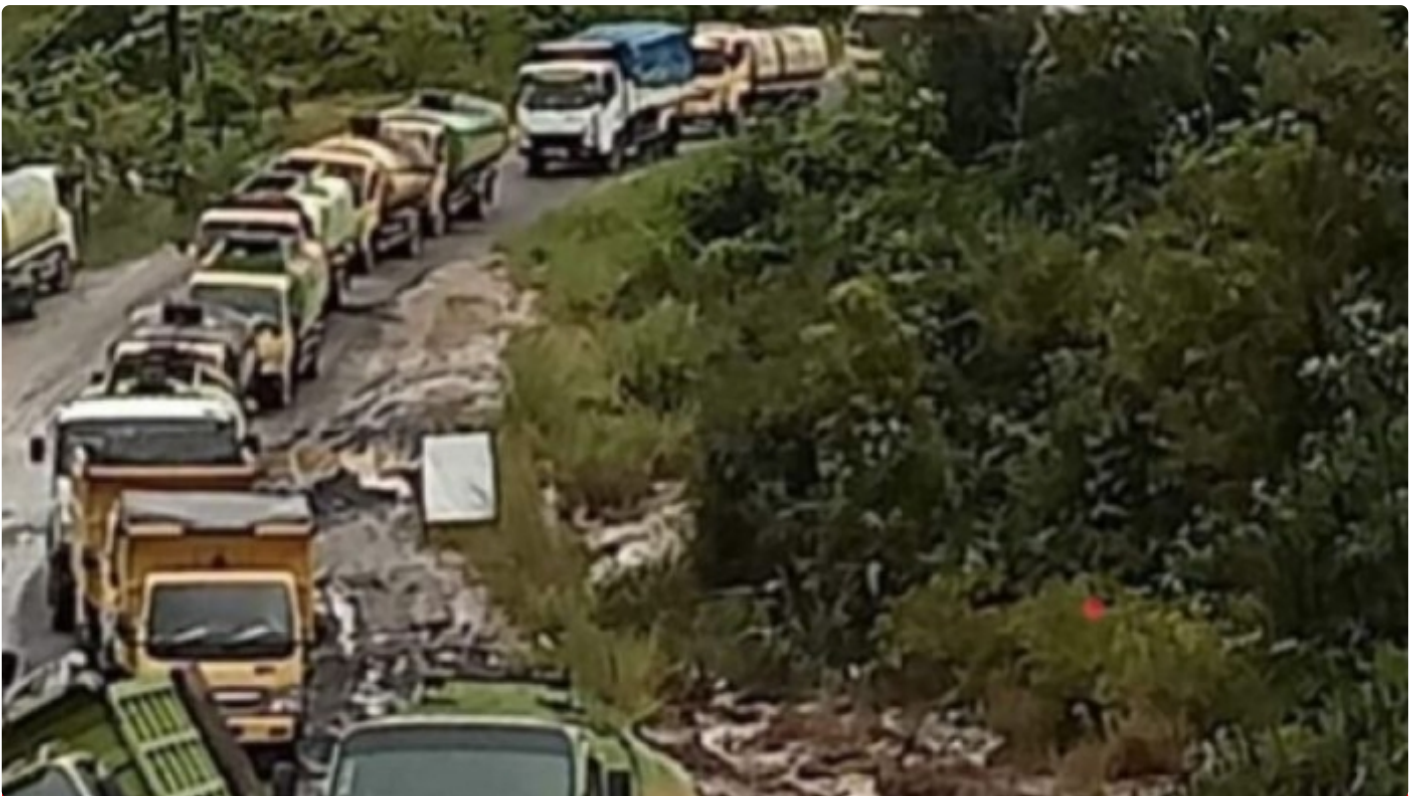
Gambar Saat Kondisi Jalan Kuala Kurun Gunung Mas

PALANGKA RAYA - Keprihatinan masyarakat Kabupaten Gunung Mas (Gumas) terhadap infrastruktur jalan yang selama ini mereka gunakan dalam aktivitas sehari - hari, belum lah selesai seperti apa yang diharapkan selama ini.